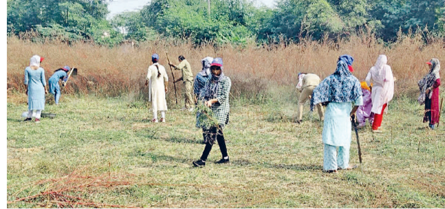
बहादुरगढ़। जसौरखेड़ी कॉलेज में सफाई करती स्वयंसेविकाएं।