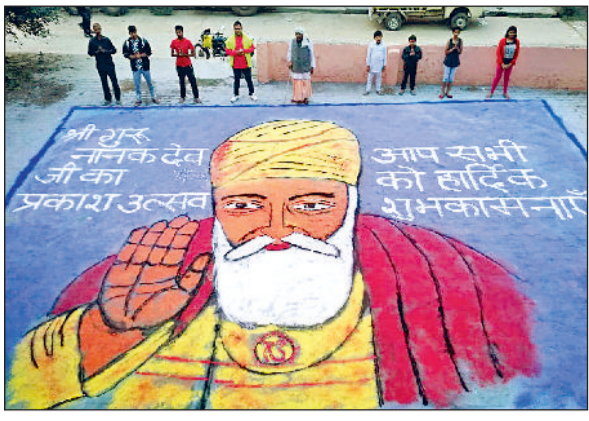
झज्जर। भदना गांव की चौपाल में बनाया गया विशाल रेखाचित्र।