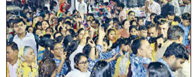
बहादुरगढ़। भक्ति और उल्लास के साथ नगर परिक्रमा निकालते श्रद्धालु।