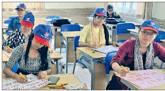
बहादुरगढ़। पोस्टर स्लोगन बनाती वैश्य बीएड कॉलेज की छात्राएं।