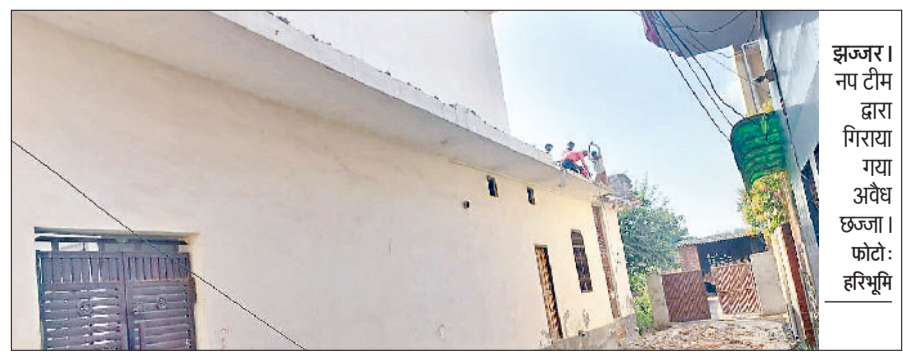
झज्जर। नप टीम द्वारा गिराया गया अवैध छज्जा।