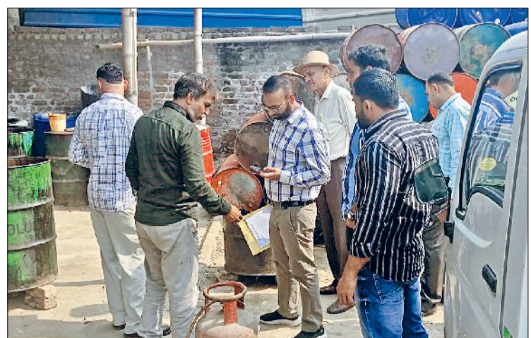
बहादुरगढ़। अवैध इकाई में जांच करते संयुक्त टीम के सदस्य।

मंगलवार को स्टेट एनवायरमेंट स्पेशल टास्क फोर्स की संयुक्त टीम ने लाइनपार क्षेत्र में परनाला के निकट अवैध रूप से संचालित औद्योगिक इकाइयों पर छापेमारी की। जांच के दौरान टीम को 6 यूनिट्स ऐसी मिलीं, जहां प्लास्टिक वॉशिंग व डाईंग आदि गतिविधियां बिना किसी वेध अनुमति के की जा रही थीं। संयुक्त टीम में प्रदूषण नियंत्रण बोर्ड, नगर परिषद, बिजली निगम, सिंचाई विभाग, पंचायत विभाग और पुलिस विभाग के अधिकारी शामिल रहे।