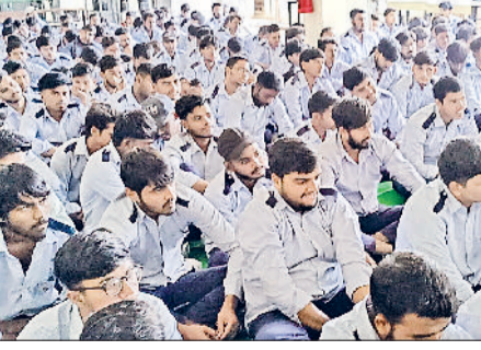
बहादुरगढ़। सेमिनार में उपस्थित आईटीआई के विद्यार्थी व सकारात्मक सोच का महत्व जानती छात्राएं।