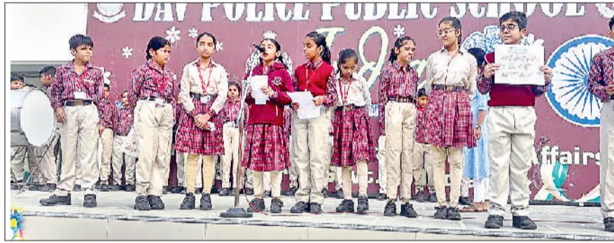
झज्जर। कार्यक्रम के दौरान अपनी प्रस्तुति देते हुए विद्यार्थी।

डीएवी पुलिस पब्लिक स्कूल में गुरु नानक देव जी का जन्मदिवस धूमधाम से मनाया गया। जिसमें स्कूल स्टाफ सदस्यों और विद्यार्थियों ने बड़ चढ़ कर भाग लिया। विद्यार्थियों द्वारा गुरु नानक के जीवन से संबंधित विभिन्न विचार