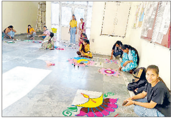
झज्जर। रंगोली प्रतियोगिता में भाग लेते हुए छात्राएं।