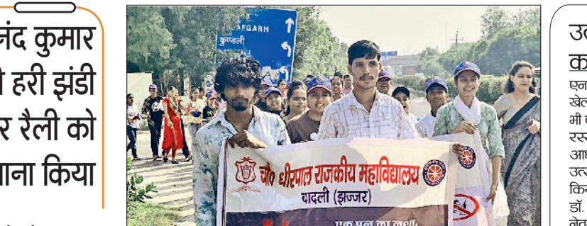
बहादुरगढ़। जागरूकता रैली निकालते बादली कॉलेज के स्वयंसेवक।