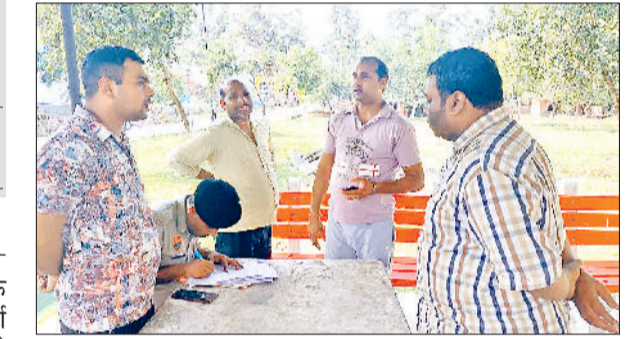
झज्जर। अस्पताल परिसर में पोस्टमार्टम के लिए कागजी कार्रवाई करते पुलिसकर्मी।